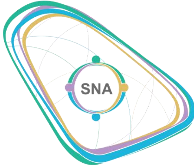
الجمعية السعودية للممرضين Saudi Nurses Association